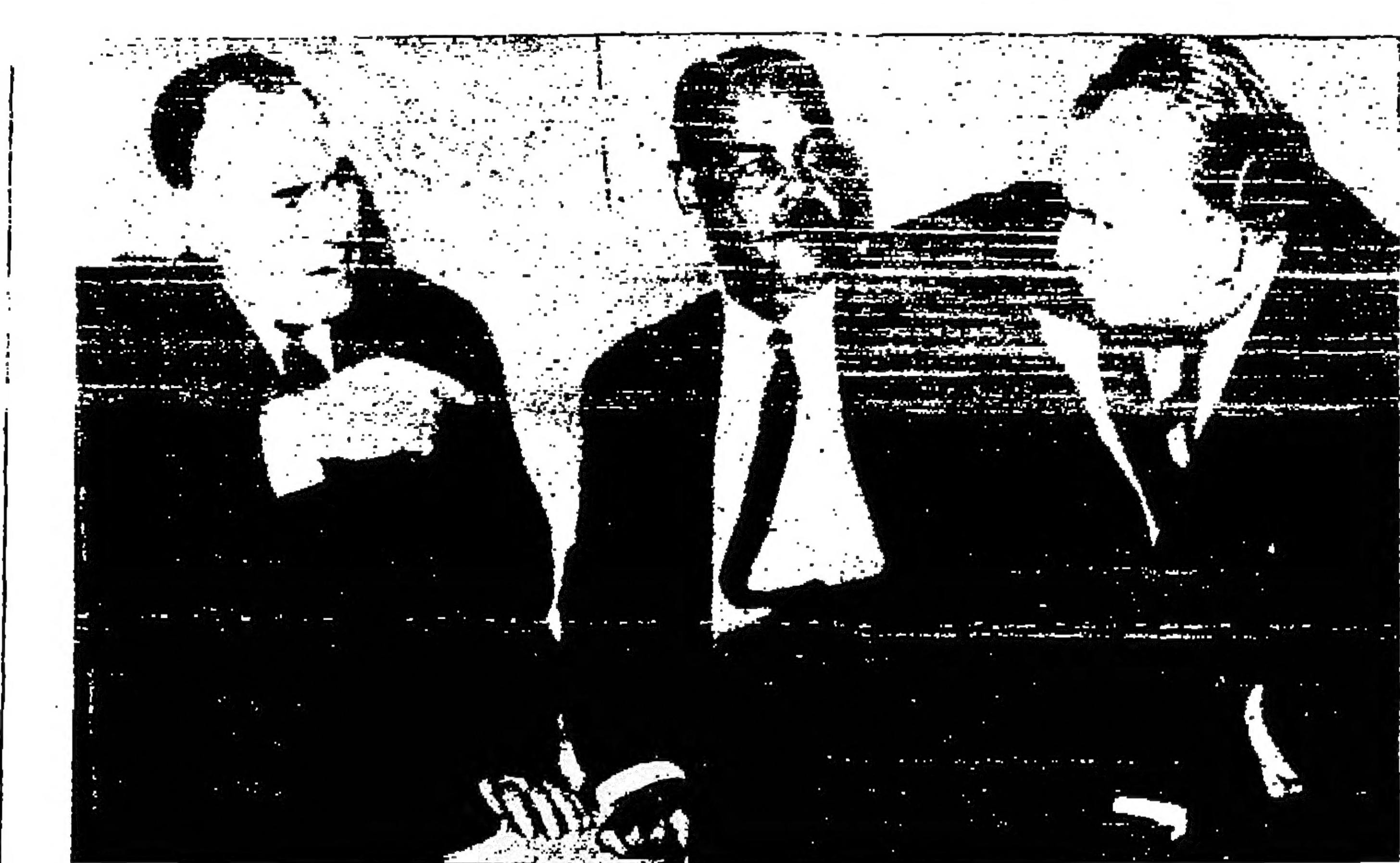
نائب رئيس الوزراء السوفياتي نيكولاي اوسيفوف مع وزير الخارجية المصري جمال عبد الناصر في القاهرة.

الامم المتحدة - رويتر - اقترحت اربعون دولة افريقية اسوية روسيا وامس ان يعمل مجلس الامن الدولي بصرمة فرض عقوبات افريقية شاملة على جنوب افريقيا.